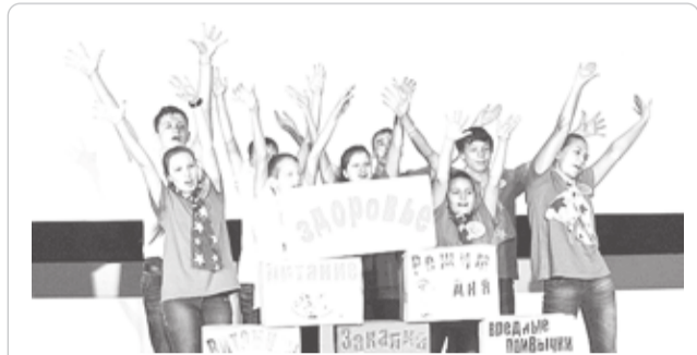
МЦ «Решма» - территория здоровья