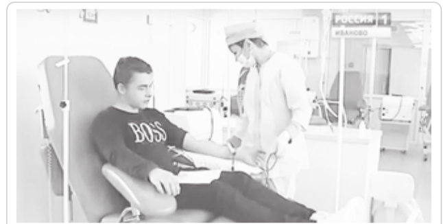
Донорская кровь спасает жизни